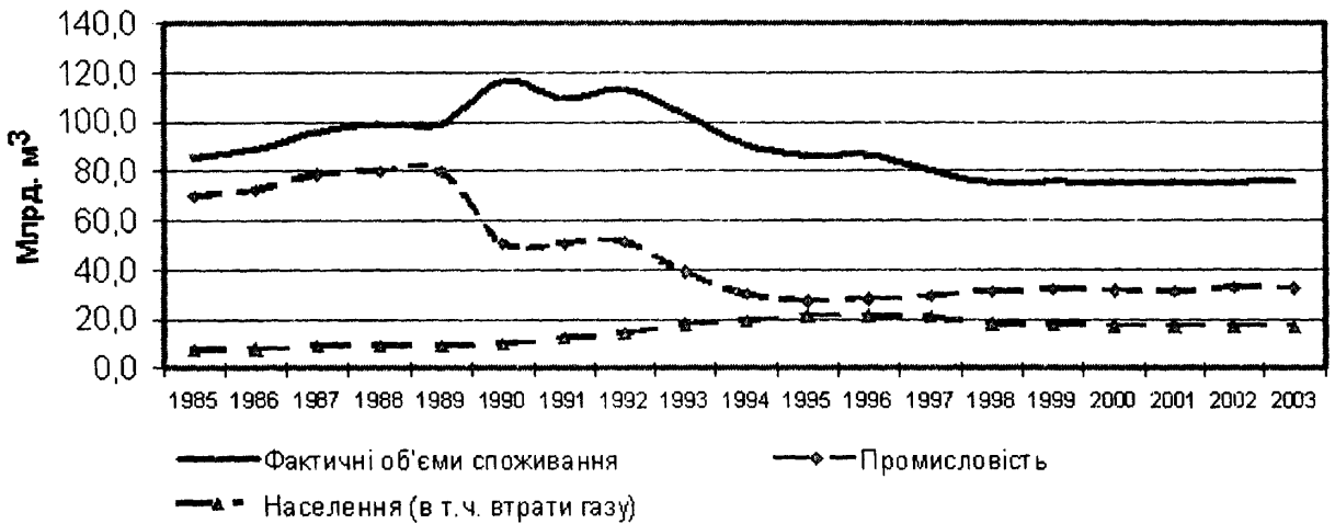
Рисунок 1. Динаміка споживання природного газу в Україні в 1985–2003 роках, млрд. м 3

При зведенні балансу надходження та реалізації природного газу газозбутовим підприємством усіх споживачів умовно поділяють на групи (категорії), кожна з яких має свої особливості споживання та ціноутворення, а саме: