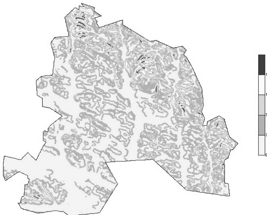
Рисунок 2 – Карта крутизни схилів

Важливим показником ерозії є ерозійний потенціал рельєфу. Це комплекс властивостей рельєфу, які призводять до виникнення і концентрації стоку. Практично ерозійний потенціал визначається топографічними факторами ерозії – довжиною і крутизною схилу [3, 4].