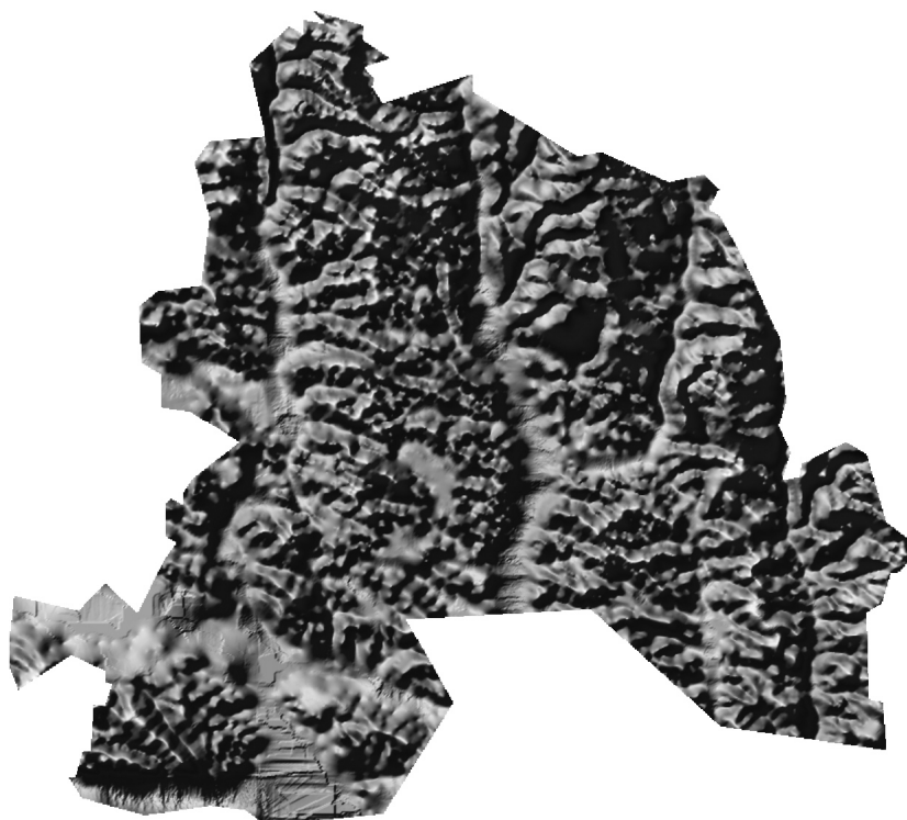
Рисунок 1 – Модель рельєфу Рогатинського району