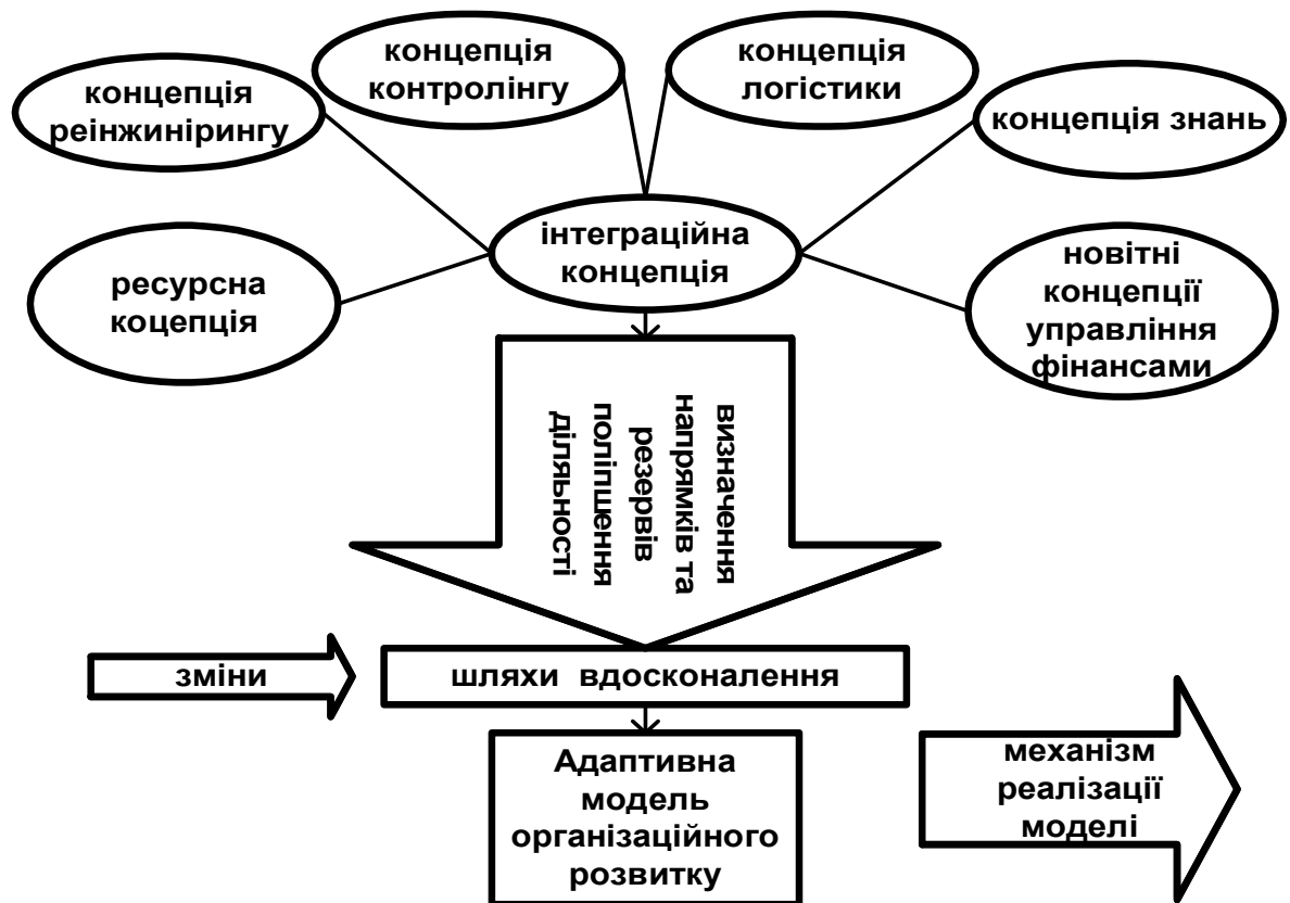
Рисунок 2 — Схема формування моделі розвитку підприємств на основі сучасних концепцій менеджменту

Прикладне значення концепції менеджменту знань у діяльності підприємств нафтогазового комплексу є складання карти знань, під якою розуміють опис місця знаходження сфери знань, понять, документів, опис знань окремих співробітників, підрозділів, які дозволяють об'єднати складові знань та отримати загальне уявлення про структури, співробітників, що мають певні знання; про співвідношення між різними категоріями знань [8, с.163]. Карти знань можуть використовуватись для класифікації, аналізу та оцінки знань організації.