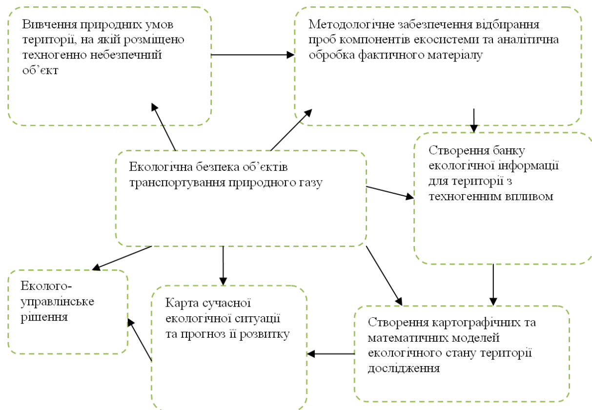
Рисунок 2 – Статична модель екологічної безпеки об'єктів транспортування природного газу