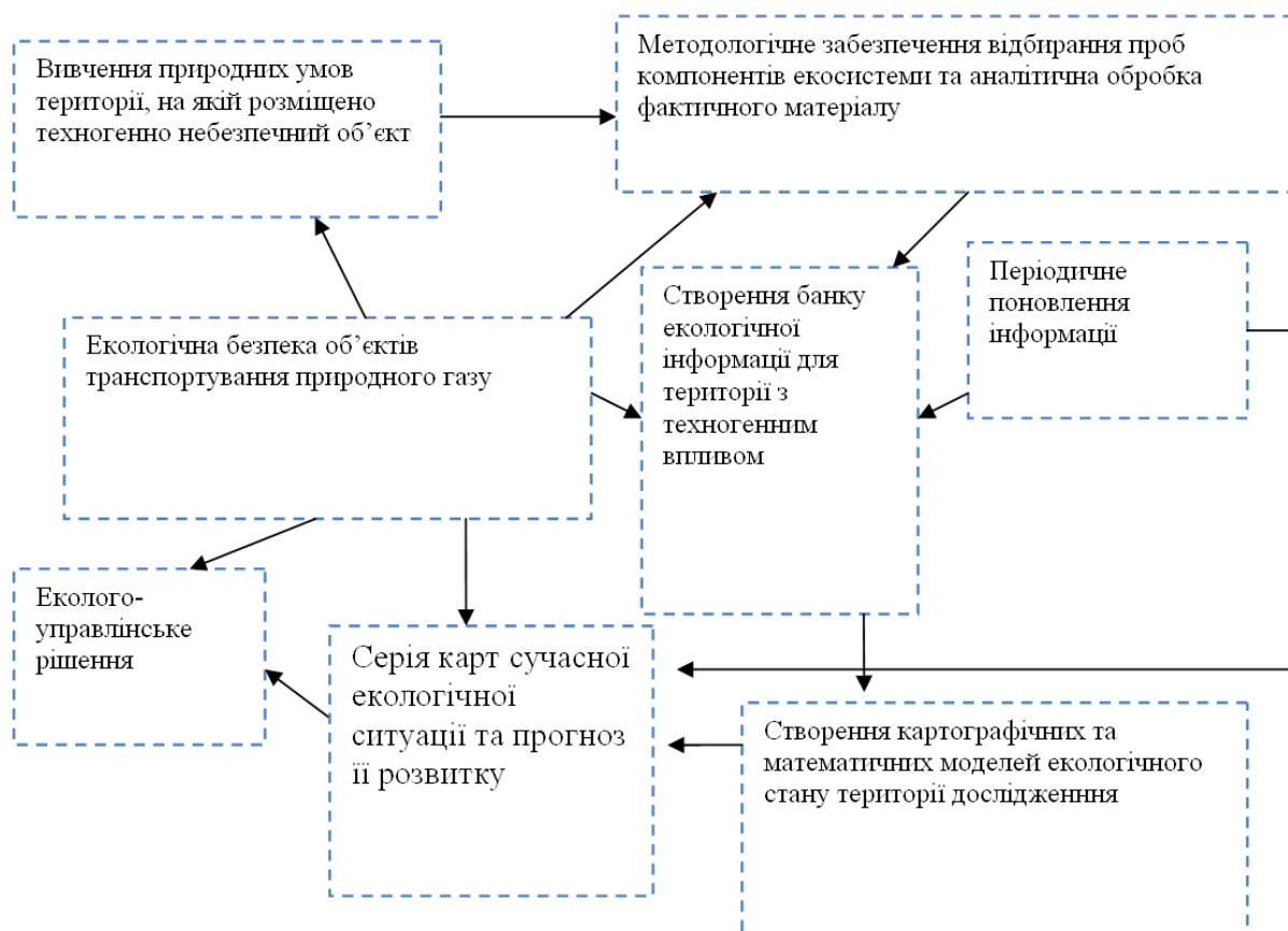
Рисунок 3 – Динамічна модель екологічної безпеки об'єктів транспортування природного газу