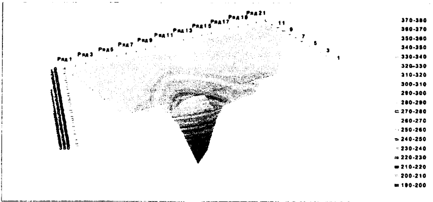
Рисунок 1. – Результати математичного моделювання поля швидкостей фільтрації при появі витoku з газопроводу

Третій розділ присвячено аналітичним дослідженням нестационарних процесів у газопроводах, викликаних появою аварійних витоків газу.