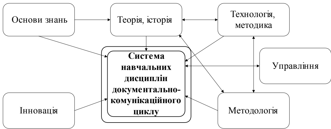
Рис. 1 - Аспектна структура навчальних дисциплін документально-комунікаційного циклу

Гносеологічний інструментарій об'єктного й аспектного підходів дозволяє побудувати логічну послідовність взаємопов'язаних блоків-модулів пропедевтичної, фундаментальної та спеціальної підсистем у структурі підготовки майбутніх бібліотечно-інформаційних фахівців вищої кваліфікації, визначити інваріантні та варіативні змістові її складові. Пропедевтичний блок підготовки бібліотечно-інформаційних фахівців мають забезпечувати ВНЗ України I-II рівнів акредитації, навчальні плани та програми яких зорієнтовані на кваліфікаційний рівень молодшого спеціаліста. Необхідно запровадити єдиний підхід до змістової складової курсу «Основи документознавства», тематичний план якого має бути розроблений для ВНЗ I-II рівнів акредитації на базі чіткого розмежування його наповнення з навчальною дисципліною «Документознавство»/«Документологія», що викладається на бібліотечно-інформаційних факультетах ВНЗ України III-IV рівнів акредитації та розрахований на кваліфікаційний рівень бакалавра.