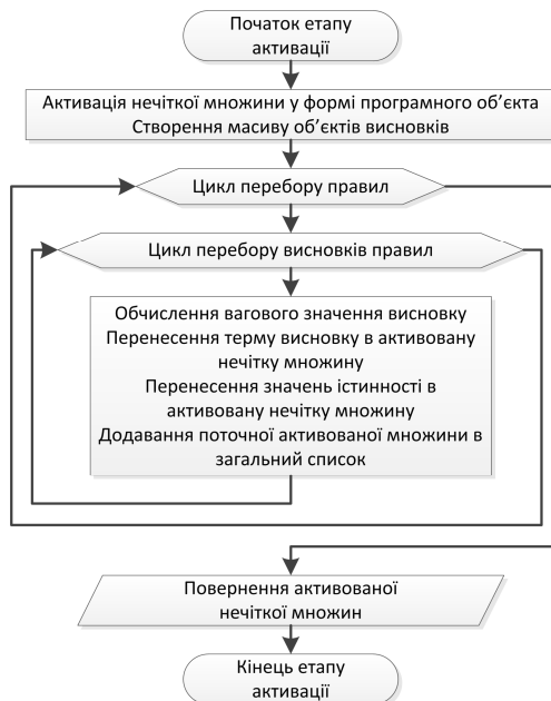
Рисунок 4 – Блок-схема етапу активації