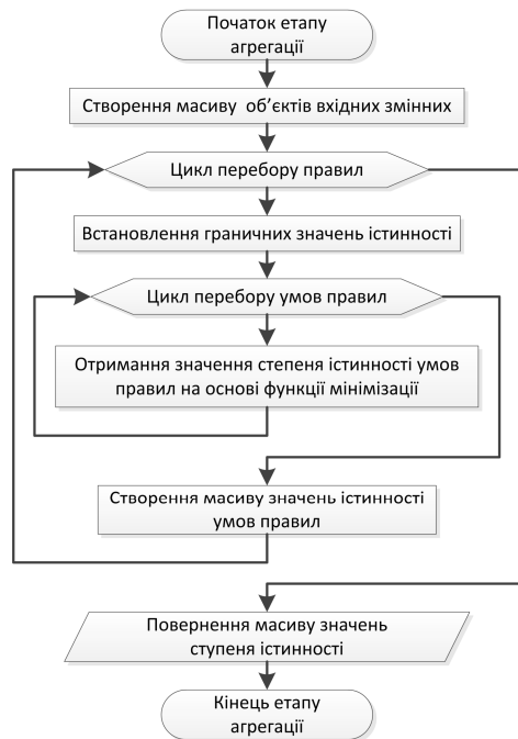
Рисунок 3 – Блок-схема етапу агрегації

де: [\mu_{concl_i}^{Set}(t)] – активована функція належності; \mu_{concl_i}^{Set}(t) – функція належності терма; Verify(conclusion_i) – ступінь істинності i -го підвисновку; i = 1..m , m \in N . Виконання даної послідовності кроків дасть змогу в кінцевому висновку отримати для кожного підвисновку на множині правил певну сукупність активованих нечітких множин: