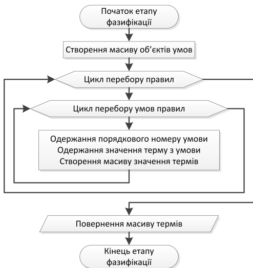
Рисунок 2 – Блок-схема етапу фазифікації