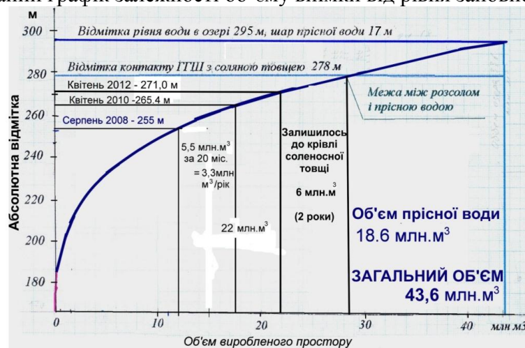
Рис. 1. Графік залежності між рівнем та об'ємом затоплення

Затоплення кар'єру. Методика прогнозування динаміки затоплення кар'єрних виїмок запропонована А.М.Гайдіним у 2003 році [1]. У випадку Домбровського кар'єру завдання спрощується тим, що до досягнення рівнем підшови четвертинного водоносного горизонту водоприток залежить тільки від метеорологічних факторів. Для визначення притоку побудований графік залежності об'єму виїмки від рівня заповнення (рис.1).