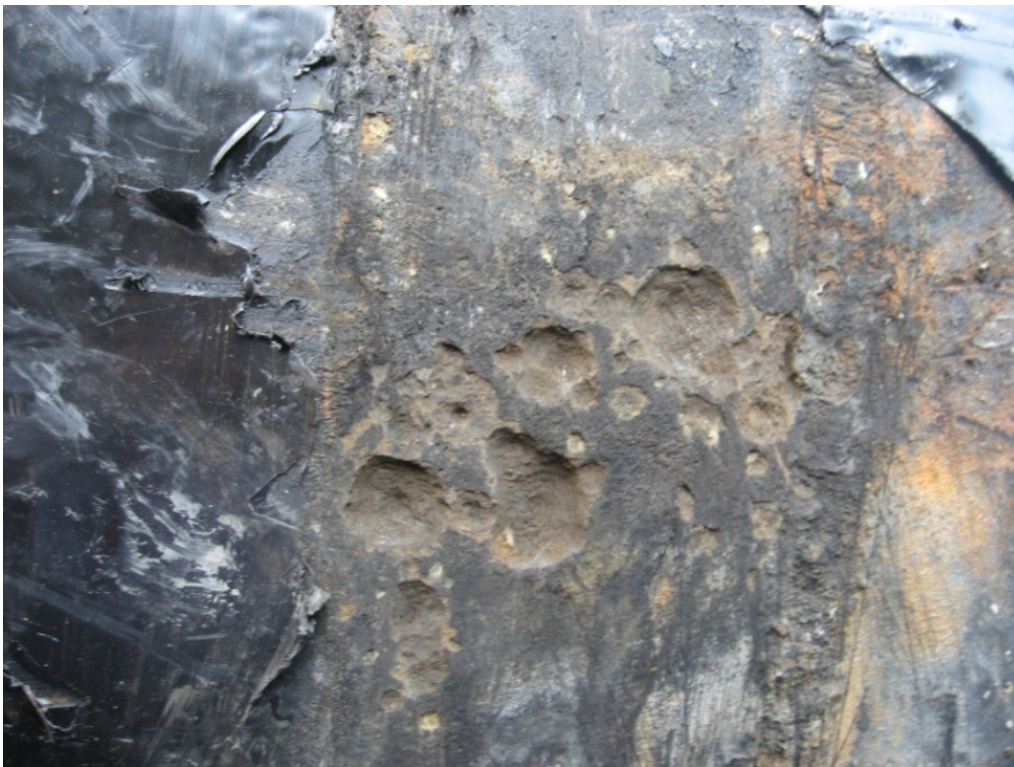
Рисунок 2 – Деградація бітумного покриття

тання і розвиток корозійноактивних мікроорганізмів, з метою надання покриттям біостійкості є актуальною задачею як в науковому, так і практичному аспектах. Встановлено, що найбільш значної дії бактерій зазнає нафтовий бітум в агресивних і дуже агресивних ґрунтах. За тривалої експлуатації трубопроводів з бітумним покриттям в трасових умовах проходить деградація ізоляційного покриття з втратою його діелектричних властивостей, а з часом можливе розтріскування захисного покриття, розвивається підплівкова корозія, внаслідок якої утворюються ямки на металі (рис. 2).