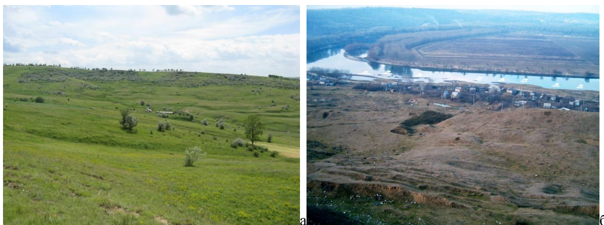
Рис. 3. Формирование оползней на территории Республики Молдовы:

Анализ геологического строения, механизма и динамики оползней сложного смещения позволяет, учитывая их формирование и развитие, выделить два основных подтипа: скольжения-течения с признаками выплывания (выдавливания) с преимущественным развитием деформаций ползучести и течения; течения-скольжения с преобладанием деформаций сдвига и скольжения, представляющих собой течение локализованное в узкой зоне смещения блоков. Сложный оползень течения-скольжения развивается в верховьях эрозионно-оползневого цирка, расположенного в 2,5 км к югу от пгт. Ниспорень (рис. 3, а) [5].