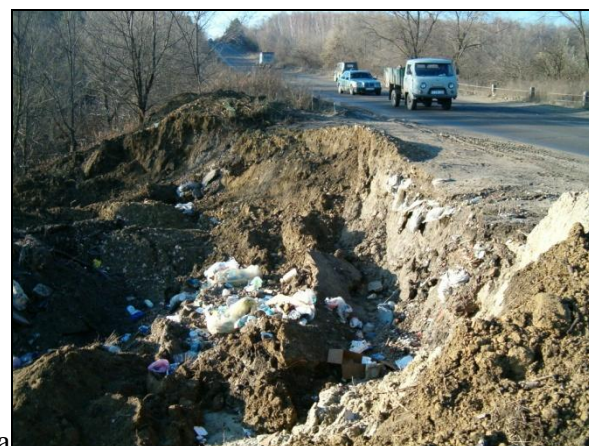
Рис. 2. Формирование оползней течения, что представляют угрозу автодороге: а) оплывины в откосах выемки автодороги Кишинев–Черновцы; б) сплывы в насыпи автодороги Кишинев–Черновцы