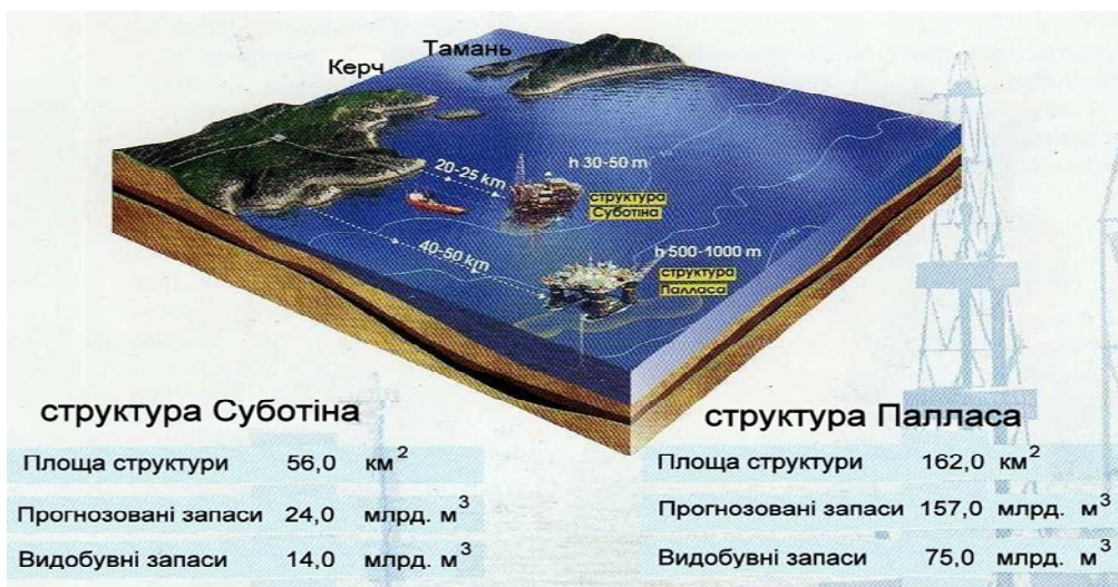
Рисунок 2 – Перспективні родовища Прикерченської ділянки Чорного моря