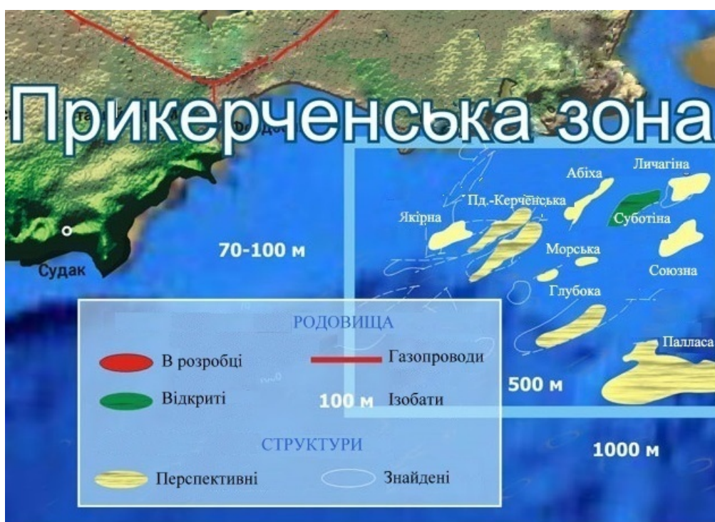
Рисунок 3 – Виявлені та перспективні структури Прикерченської ділянки Чорного моря

Що стосується глибоководної западини Чорного моря, то, як вже було сказано, поклади вуглеводнів на глибині понад 200 м є практично не вивченими. За оцінками експертів, запаси енергоносіїв на українській ділянці шельфу Чорного моря розвідані лише на 4-5%. Щоб провести повну розвідку хоча б третини вуглеводневих покладів у Чорному морі, потрібно 5-7 років та багатомільярдні інвестиції.