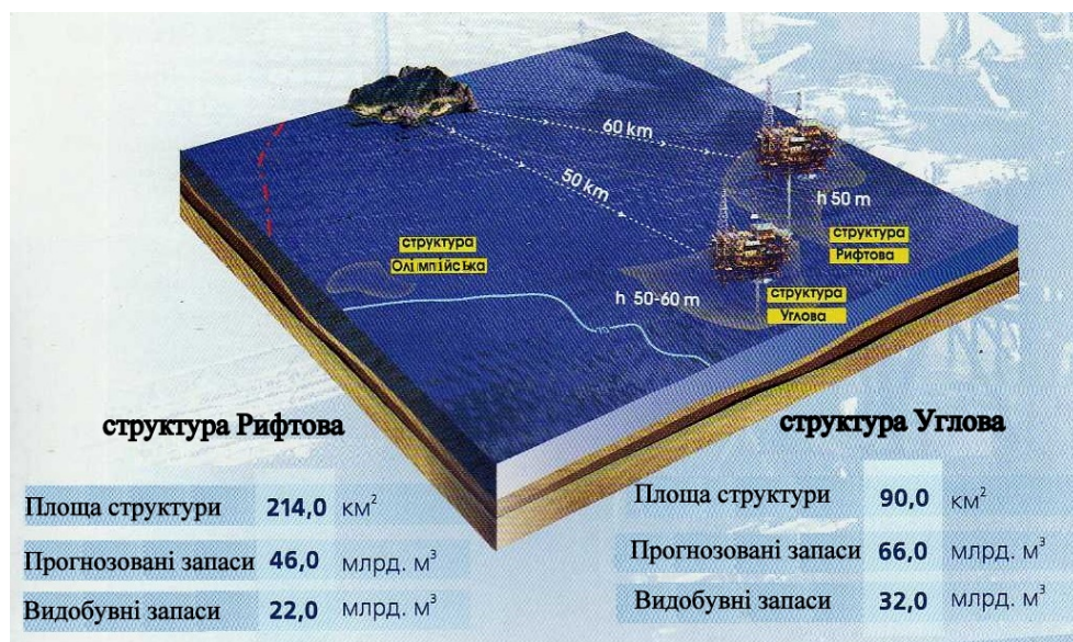
Рисунок 1 – Високоперспективні структури північно-західної частини шельфу Чорного моря

займаються освоєнням шельфу з метою видобутку газу і нафти. Безперечним лідером у цій сфері є Турецька Республіка, яка має другу за довжиною (після України) лінію узбережжя у Чорному морі. Спільним для чорноморських країн є те, що всі вони залучають до освоєння своїх частин шельфу потужні, здебільшого транснаціональні компанії, які мають великий досвід, сучасні технології і значні фінансові ресурси для розвідки, видобутку, транспортування і переробки енергоносіїв. Жодна з чорноморських країн, включаючи Росію, не має власних плавучих платформ для видобутку енергоносіїв на морських глибинах до 2000 м і на глибині залегання енергоресурсів до 9000 м.