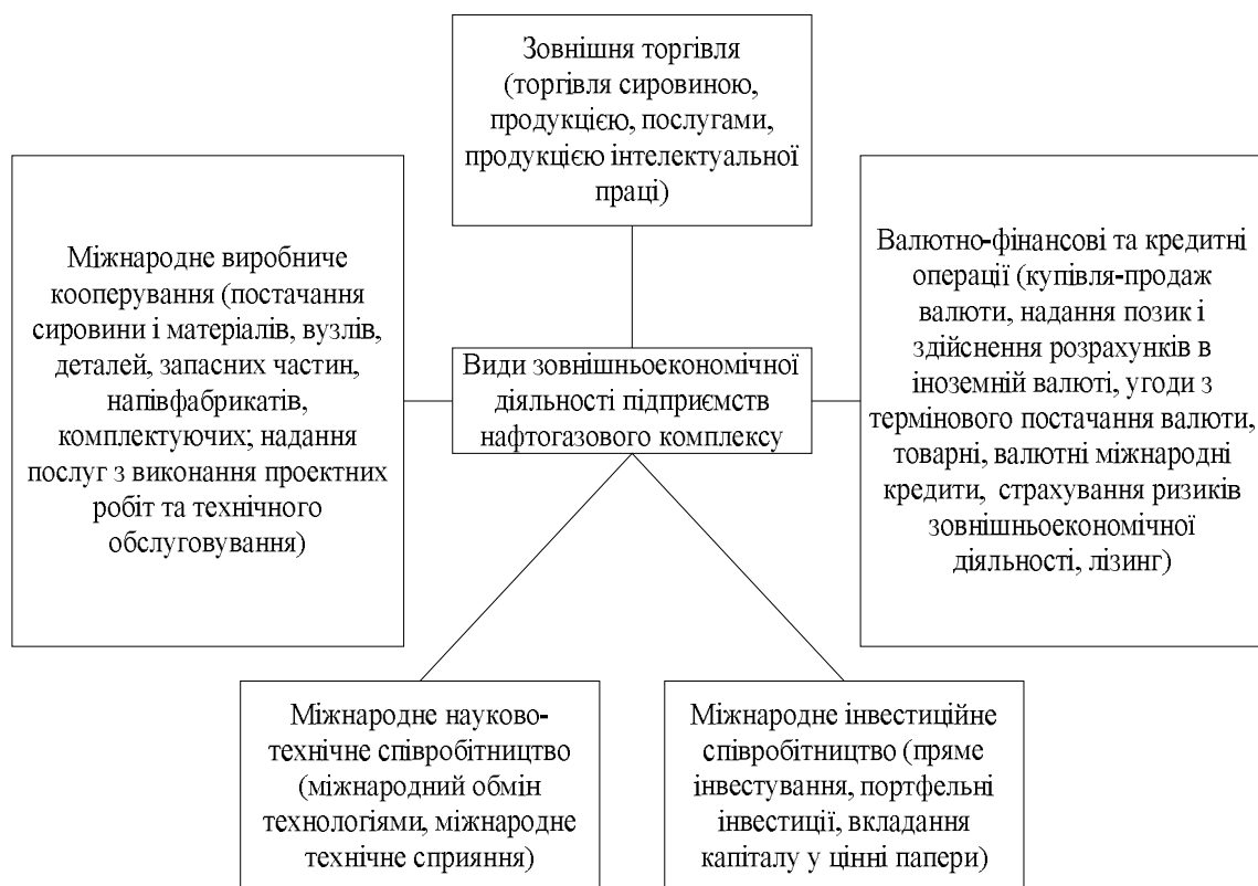
Рисунок 1 – Види зовнішньоекономічної діяльності, які здійснюють підприємства нафтогазового комплексу

які технологічно є більш розвинутими. Інтеграційне об'єднання МС не створює (додаткового) доступу до сучасних чинників виробництва (технологій виробництва та менеджменту тощо, а також до додаткових капіталів, що зазвичай супроводжують технології). Таким чином, як зазначено у аналітичній записці відповідних досліджень, в умовах інтеграції України до МС Україна не може розраховувати на значні ефекти від інституалізації цих стосунків. Проте значним негативним наслідком вибору на користь МС стане скасування (закриття) євроінтеграційного напрямку розвитку України [20, с. 40].