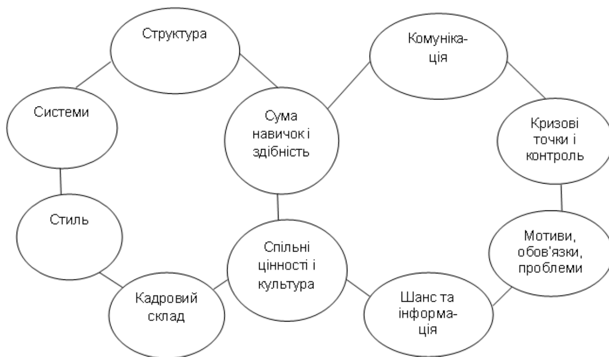
Рисунок 1 – Модель "щасливого атома" за Т. Пітерсом і Р. Уотерменом [8]

ринку нафтопродуктів. Як методологічну основу даного дослідження було використано загальнонаукові і спеціальні методи: історизму, аналізу, синтезу, дедукції та індукції, наукової класифікації і групування, наукової аналогії та структурного синтезу, опитування і спостереження, експертних оцінок і техніко-економічного аналізу, системного підходу тощо.