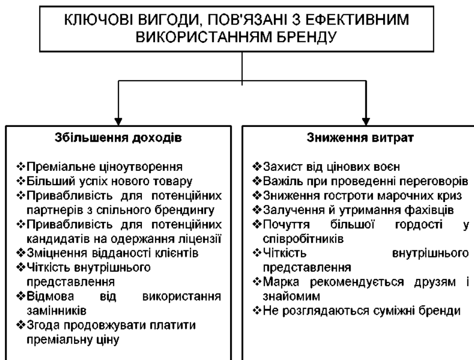
Рисунок 3 – Ключові вигоди, пов’язані з ефективним використанням бренду [4]

частиною забезпечувальної підсистеми системи управління підприємством, одним з його ключових факторів успіху [10].