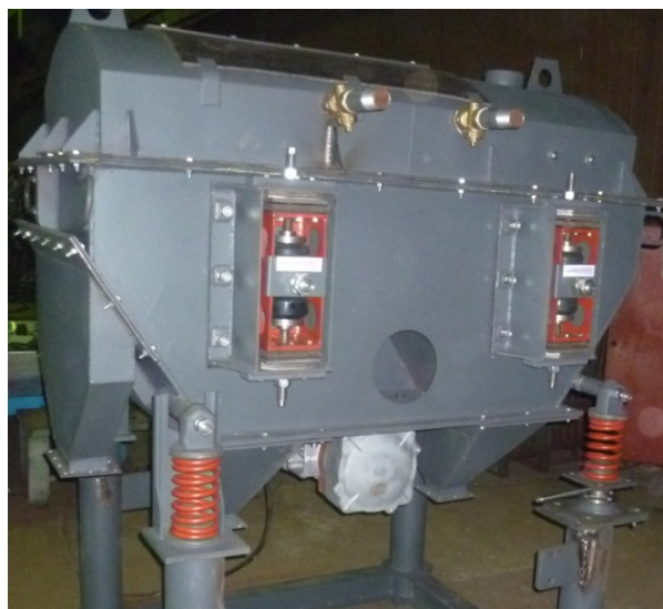
Рисунок 3 – Промышленные образцы вибрационных поличастотных грохотов MBG

зей и постоянную самоочистку сит за счет высвобождения застрявших частиц из ячеек и отрыв прилипших частиц, например, за счет поверхностного натяжения жидкости от поверхности сита.