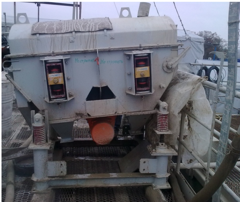
Рисунок 4 – Грохот МВГ в технології очищення бурового розчину на буровій «Володарська-2» ПАО «Шахта ім. А.Ф. Засядько»

При испытаніях, для регулювання крупності виделяемых из бурового раствора породных частиц и сравнения технико-экономических показателей очистки со стационарным оборудованием, на грохоте МВГ устанавливались полиамидные сита из стандартных ситотканей с размерами ячеек 150, 100, 80, 56 и 25 мкм, что, в том числе, соответствует крупности разделения на вибросите (151,5 мкм), песко- и илоотделителе Brandt (соответственно 50 и 25 мкм).