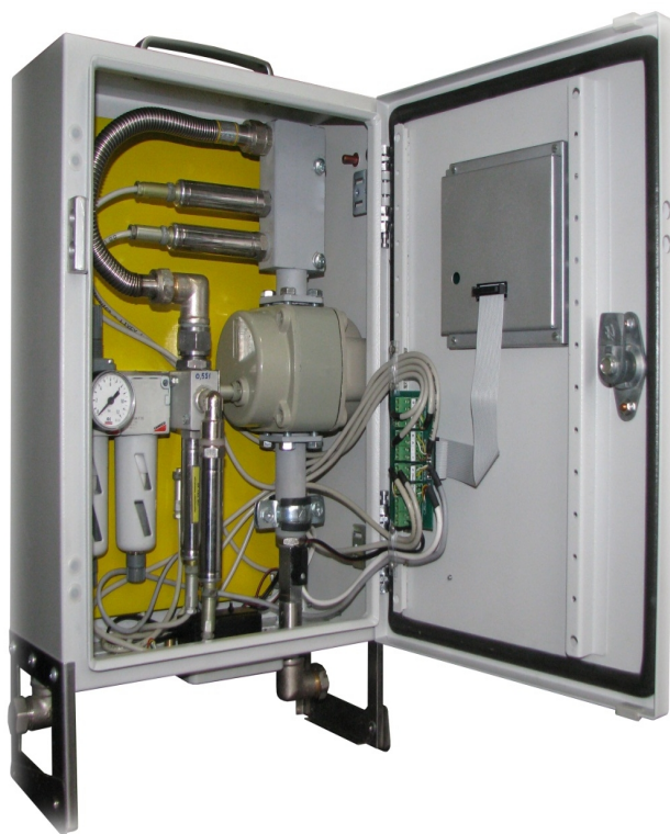
Рисунок 2 – Фотографія потокового густиноміра OE-RO2

тиску 1 і вихід трубопроводу середнього/низького тиску 2 споряджені штуцерами 19 і 20, відповідно, для під'єднання пристрою гнучкими шлангами до діючого трубопроводу на місці вимірювання.