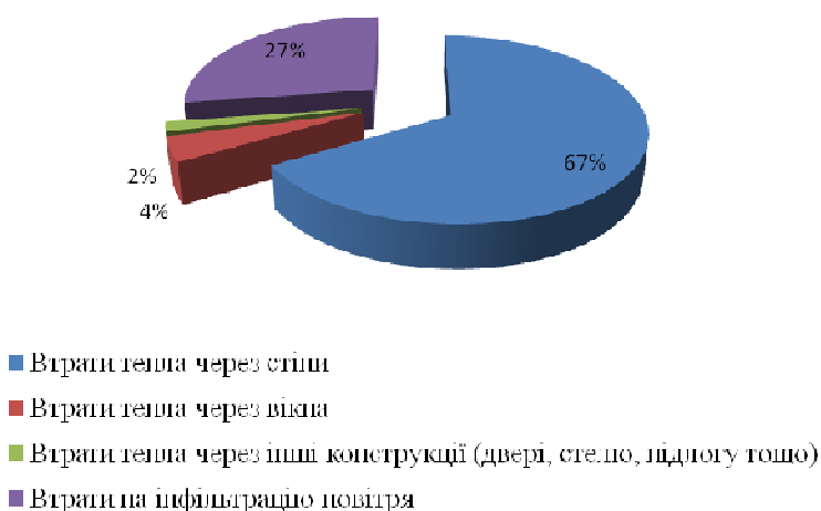
Рисунок 3 – Основні тепловтрати будинку

Порівнюємо отримані результати тепловтрат будинку без енергозберігаючих технологій із значеннями тепловтрат будинку з використання енергозберігаючих технологій та будуємо графічні залежності (рисунок 2).