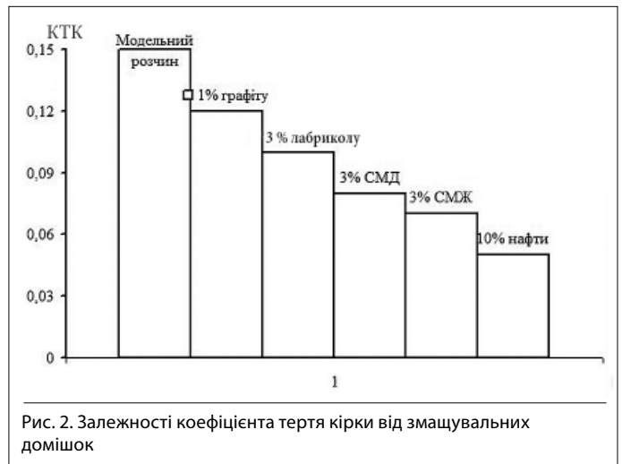
Рис. 2. Залежності коефіцієнта тертя кірки від змащувальних домішок

Слід зазначити, що установка НК-1 має недоліки, а саме: низькі показники фільтрації робочого розчину, що обумовлено недостатньою кількістю перфораційних отворів вузла фільтрування. Цей недолік заважає формуванню глинистої кірки достатньої товщини для прилипання ідентора. Недолік був усунений шляхом нарізання допоміжних циліндричних канавок (за прикладом ВМ-6) на фільтрувальному вузлі, що збільшило показник фільтрації майже вдвічі та допомогло формувати кірку.