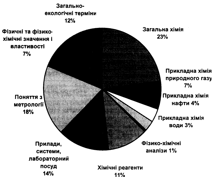
Рис. 1. Діаграма розподілу термінів за тематичними розділами.

технічної термінології" (Львів, 1992, 1993, 1994, 1996), "Проблеми українізації комп'ютерів" (Львів, 1991, 1992, 1993), "Україномовне програмне забезпечення. УкрСофт" (Львів, 1994, 1995) та який взято з найбільш авторитетних та новітніх видань, таких як "Російсько-український та українсько-російський словник з радіоелектроніки" за редакцією Б.Рицара [2] та "Російсько-український словник наукової термінології".