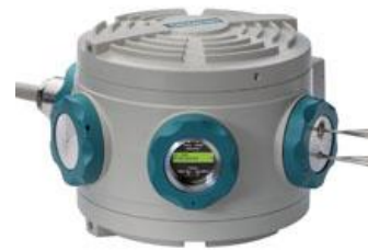
Рисунок 10 – Мікрохроматограф Micro SAM

Недоліком мікрохроматографа Micro SAM є значний час на проведення аналізу (600 с) та необхідність у газі-носії високого ступеня очищення (гелій \leq 5 \text{ пм}^3/\text{с} ).