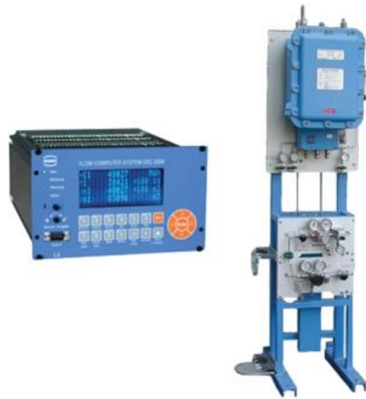
Рисунок 12 – Система EMC 500

- метод EMC 500 . Суть методу, що реалізується системою EMC 500 , розробленою RMG , полягає у вимірюванні теплоємності, теплопровідності та в'язкості газу за допомогою різних систем сенсорів. Система EMC 500 є моделлю, що продовжує систему WOM 2000 на ринку вимірювальних засобів (рис. 12) [35]. За бажання, вміст CO_2 може бути виміряний за допомогою інфрачервоного сенсора. Метод забезпечує визначення всіх необхідних властивостей, які дають змогу розрахувати фактор правового відхилення, а тому можуть бути використані для розрахунків за спожитої енергії. В Німеччині було подано заявку на офіційне затвердження цієї розробки на рівні законодавства в галузі метрології. У зв'язку з цим затвердженням Ruhrgas AG виконано польові випробування EMC 500 . Система EMC 500 дозволяє також вимірювати число Воббе.