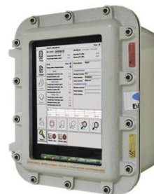
Рисунок 8 – Хроматограф “МАГ”

Промисловий газовий хроматограф “МАГ” призначений для поточкових вимірювань компонентного складу природного газу за ГОСТ 31371, Частина 7 і обчислення за компонентним складом значень величин теплоти згорання, відносної і абсолютної густини, коефіцієнта стисливості і числа Воббе (відповідно до ГОСТ 31369) [25]. Застосування в хроматографі аналітичних модулів створених на базі MEMS технологій, що містять мікродетектор, мікроінжектор і капілярні колонки дозволило забезпечити малі габарити приладу (рис. 8), високу швидкість аналізу в поєднанні з високою точністю вимірювань, низьке споживання електроенергії і газу-носія. У хроматографі реалізовано зворотне продування, що дозволяє отримати сумарний пік гексану і важчих вуглеводнів в строгій відповідності з ГОСТ 31371.7.