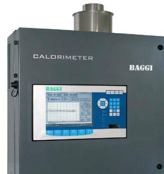
Рисунок 3 – Багатопараметровий термогазоаналізатор серії SG12WMTA

Багатопараметровий термогазоаналізатор серії SG12WMTA (BAGGI, Італія) (рис. 3) вимірює безпосередньо в реальному часі найважливіші енергетичні характеристики газу: число Воббе, калорійність, питома вага та індекс витрати повітря для горіння [19].