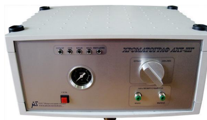
Рисунок 7 – Хроматограф “АХТ-ПГ”

використання газу-носія з високим ступенем очищення.