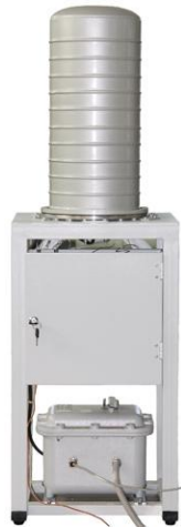
Рисунок 9 – Хроматограф ПЕТРОХРОМ-4000

До недоліків хроматографа “ПЕТРОХРОМ-4000 слід віднести, вузький діапазон робочих температур (0...+40 °C) та значний час виходу на робочий режим (біля 2 год.), що ускладнює його застосування для проведення експрес-контролю характеристик природного газу.