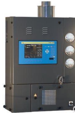
Рисунок 2 – Калориметр CWD2000

До недоліків калориметра CWD2000 слід віднести: значну витрату газу на спалювання (15...200 л/год. в залежності від властивостей газу), неможливість роботи приладу в польових умовах через значні габарити (1016×762×330 мм) та вагу (50,5 кг), обмежений діапазон робочих температур (мінус 5...плюс 40°C) і вибухонебезпеку.