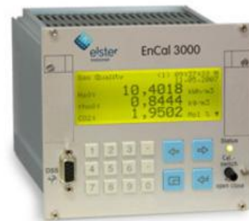
Рисунок 5 – Хроматограф „EnCal 3000”

До основного недоліку хроматографа EnCal 3000 слід віднести необхідність роботи у закритому приміщенні з температурою, вищою за 0 °C та відповідною вологістю, що унеможлиблює його використання в польових умовах безпосередньо на газопроводах у будь-якому пору доби і року. Також недоліком є необхідність у використанні газів-носіїв.