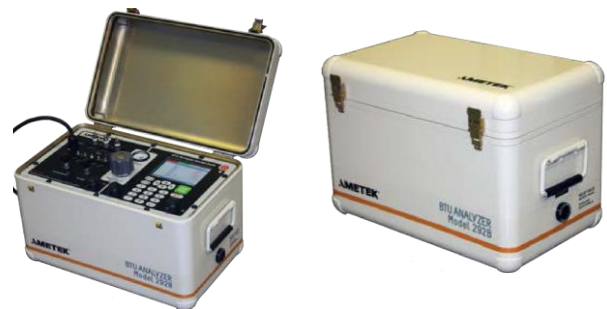
Рисунок 11 – Аналізатор природного газу АМЕТЕК модель 292В

Аналізатор природного газу AMETEK модель 292B (США) представляє собою легкий, міцний портативний хроматограф, що використовується для аналізу складу та визначення теплотворної здатності зразка трубопровідного газу на місці [28]. Модель 292B призначена для роботи в якості автономного пристрою, здатного вимірювати зразки газу безпосередньо в польових умовах, і підходить для установки в мобільній платформі, такий як вантажівка, фургон або автомобіль (рис. 11).