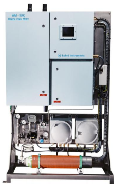
Рисунок 4 – Калориметр WIM9900

Переваги аналізатора: швидке реагування, висока точність і низький рівень шуму, великий ефективний діапазон виміру 0-100 МДж/м 3 ; мінімальне технічне обслуговування, підходить для агресивних газів і з домішками сірки.