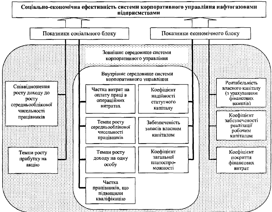
Рисунок 1 – Візуалізація моделі оцінювання СЕЕСКУНП

Побудована 12-факторна регресійна модель оцінювання соціально-економічної ефективності системи корпоративного управління нафтогазовими підприємствами (рис. 1), поповнить методичний інструментарій оцінювання з метою відтворення динаміки ефективності в контексті прогнозованих реакцій такої системи на реальні виклики середовища її функціонування.