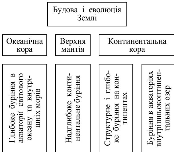
Рисунок 1 — Основні об'єкти і типи наукового буріння

програма з проблеми “Вивчення надр Землі і надглибоке буріння”. Програма передбачала три основні групи завдань: вивчення будови і еволюції різних типів крупних геологічних структур; вивчення умов рудо-і нафтогазоутворень і закономірностей розміщення родовищ корисних копалин; розвиток нових технічних засобів і технологій глибинного вивчення надр Землі [2].