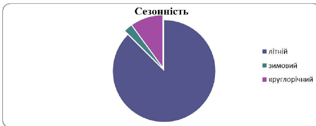
Рис. 2. Переваги респондентів щодо сезонності відпочинку

Слід відзначити, що активний відпочинок (туризм) може знижувати рівень захворювань на найнебезпечніші серцево-судинні хвороби майже наполовину. Не набагато менша його дія в попередженні психічних розладів. Захворювання органів дихання зменшуються майже на 40%, нервів і кістково-м'язової системи – майже на 30%, органів травлення – більше як на 20%. Багаторічні дослідження показують, що в перший місяць після активного відпочинку відновлюваність праці зростає на 15-25%, в подальшому вона знижується і через 4-8 місяців досягає попереднього (до відпочинку) рівня. Це означає, що середньорічний приріст продуктивності праці, в результаті активного відпочинку, який базується на широкому використанні природних та історико-культурних рекреаційних ресурсів, знаходиться на рівні 3%. Наведені дані наочно характеризують роль активного відпочинку, як інтенсивного фактора відновлення робочої сили науково-педагогічних працівників. Якщо ж врахувати вплив рекреації на зростання