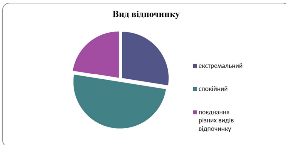
Рис. 3. Види відпочинку, яким надають перевагу респонденти

Відвідання місць, які цікавлять працівників під час відпустки: поєднання відпочинку на природному середовищі з відвідуванням історичних та архітектурних пам'яток цікавить найбільше – 45%, природне середовище цікавить 40% працівників, та відвідування історичних та архітектурних пам'яток – 15% (рис. 4).