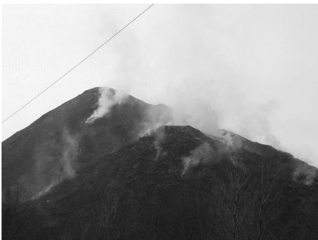
Рис. 1. Тліючі шахтні відвали

Просідання земної поверхні по Донецькому басейну в середньому коливається в межах від 1,5 до 2,5 м, внаслідок чого сформувалася регіональна депресійна воронка глибиною 25-40 м [5]. З просіданням земної поверхні тісно пов'язані процеси затоплення і підтоплення територій, які супроводжуються руйнуванням будівель і споруд, порушенням умов гідрогеології регіону.