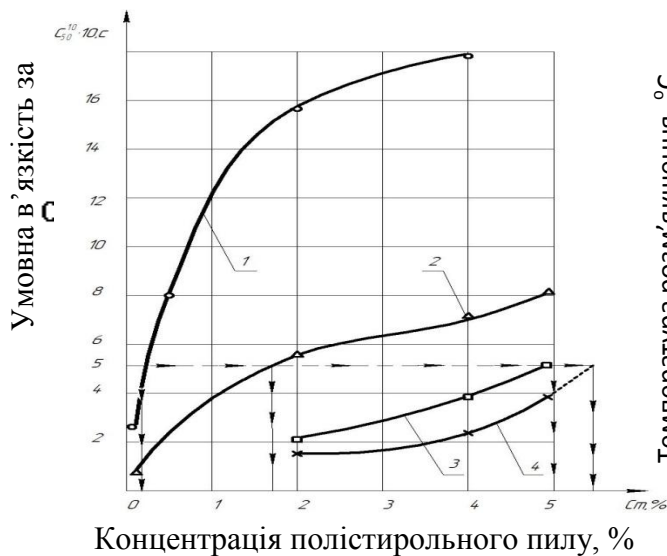
Рис. 4. Діаграма для визначення еквів'язкої ( C_{50}^{10}=50 с) концентрації C_m ПСП у в'язучому на дьогтях з вихідною в'язкістю: 1 – C_{50}^{10}=29 с; 2 – C_{30}^{10}=250 с; 3 – C_{30}^{10}=150 с; 4 – C_{30}^{10}=50 с