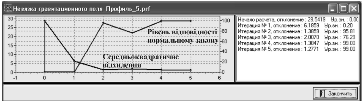
Рисунок 2 — Залежність величини середньоквадратичної похибки та величини статистичної оцінки відповідності відхилення між спостереженим і розрахованим гравітаційними полями від номеру ітерації

На рисунках 1 і 2 зображено результати розв'язування оберненої задачі гравіметрії по регіональному транскарпатському перетину, які ілюструють зміну величини відповідності розподілу величини відхилення між спостереженим та розрахованим гравітаційними полями в процесі ітеративного підбору параметрів геогустинної моделі середовища. Як бачимо на рисунку 2, вже на другому кроці ітераційного процесу відхилення між спостереженим та розрахованим гравітаційними полями може вважа-