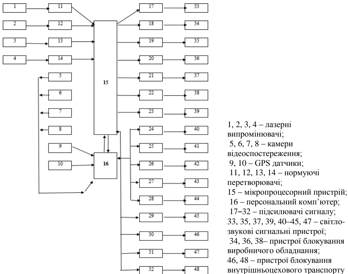
Рис. 2. Принципова схема роботи системи автоматизованого захисту небезпечних зон та підвищення безпеки руху внутрішньоцехового транспорту (САЗНЗтаПБРВТ)

випромінювачі, які встановлені в небезпечних зонах виробничого обладнання, камери відеоспостереження за технологічним процесом, датчики GPS, які встановлені на внутрішньо цеховому транспорті підприємства, нормуючі перетворювачі, керуючий мікропроцесорний пристрій (КМП), персональний комп'ютер (ПК), підсилювачі сигналу, світло-звукові сигнальні пристрої, пристрої блокування виробничого обладнання і внутрішньоцехового транспорту (рис 2).