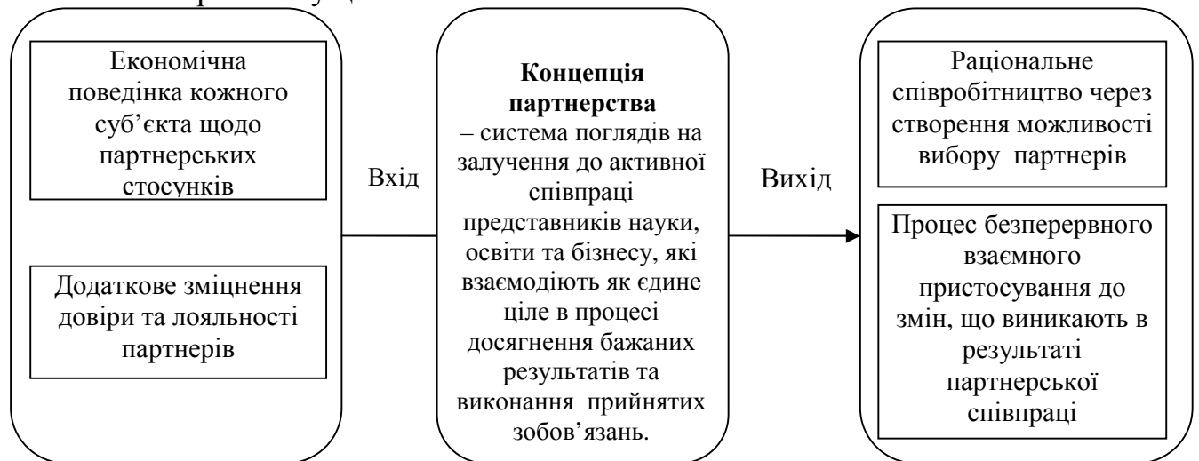
Рис. 1 Графічна інтерпретація концептуального підходу до відображення сутності партнерства

3. Теорія зацікавлених сторін є загальною й всебічною, але у той же час має також і практичну цінність.