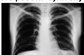
Рис. 3. Відкриття X-променів І. Пулюєм

В курсі дисципліни «Екологія людини» при вивченні розділу «Здоров'я людини на сучасному етапі» можна познайомити студентів з історією деяких найбільших відкриттів, що сприяють продовженню людського життя і боротьбі з важкими захворюваннями. Наприклад, Зельман Абрахам Ваксман (США) відкрив стрептоміцин - антибіотик, який використовується в лікуванні туберкульозу (рис. 4). Батьківщиною Ваксмана була Україна.