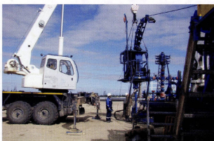
Рис. 1. Установка ГНКТ на автоплатформе для проведения геофизических исследований скважин.

«ООО «Ямал Петросервис» представляет квалифицированные услуги по промыслово-геофизическим исследованиям горизонтальных скважин с применением технологии