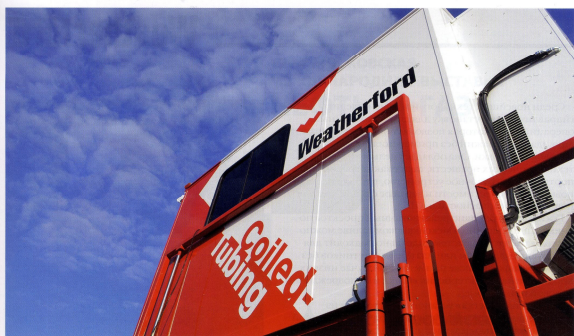
Рисунок 1 – Внутрискважинные работы через ГНКТ стали для компании Weatherford важным бизнес-сегментом Figure 1 – Coiled tubing has become a significant segment of Weatherford's business

перфорированных интервалов за одну СПО на гибких НКТ.