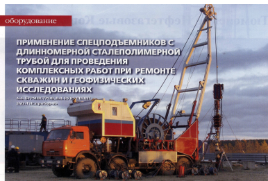
Оборудование ПРИМЕНЕНИЕ СПЕЦПОДЪЕМНИКОВ С ДЛИННОМЕРНОЙ СТАЛЕПОЛИМЕРНОЙ ТРУБОЙ ДЛЯ ПРОВЕДЕНИЯ КОМПЛЕКСНЫХ РАБОТ ПРИ РЕМОНТЕ СКВАЖИН И ГЕОФИЗИЧЕСКИХ ИССЛЕДОВАНИЯХ Иллюстрация: Г. В. Кукушкин

Сейчас компания Hansen готовит этот новый насос к выходу на рынок, сосредоточившись, прежде всего, на дегидратации газовых скважин. Насос можно размещать в скважине при помощи колтубинговой установки, снаряженной концентрическими гибкими трубами».