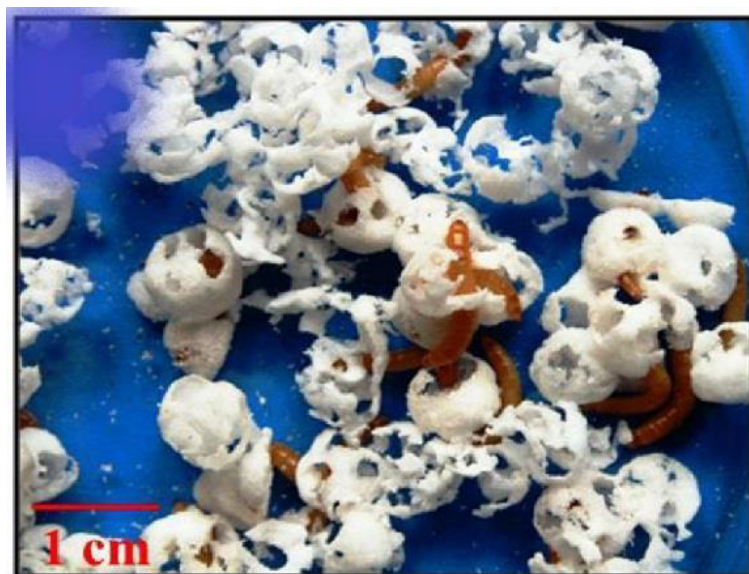
Рис.1. Експеримент зі споживання піностиролу личинками жука