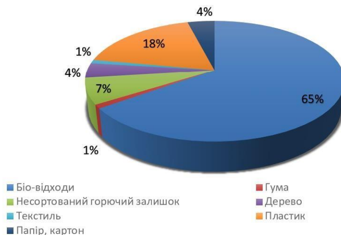
Рис. 1. Морфологічний склад ТПВ, що придатне для спалювання

Відбір проб відходів здійснено на полігоні ТПВ с. Рибне, в осінній період. Загальна кількість зразків становила 7 проб, по 1 кг., кожного виду ТПВ (рис. 2).