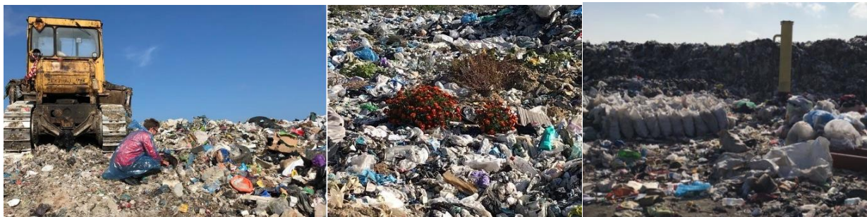
Рис. 2. Відбір проб ТПВ на полігоні с. Рибне

Підготовлено 7 проб по 1 кг. згідно встановленого компонентного складу, що наведено в табл. 1, також була підготовлена інша група дослідних зразків (твердопаливні пелети). Групи проб відходів та твердопаливних пелет готувались до проведення аналізів з метою визначення фізичних і хімічних характеристик, а також для встановлення теплотворної здатності за допомогою калориметра. Для проведення передбачених досліджень проби покомпонентно подрібнювалися ножовим подрібнювачем до величини часток не більше 0,1 мм.