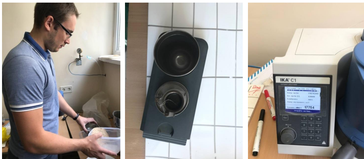
а) б) в) Рис. 3. Підготовка зразків ТПВ і пелет для визначення калорійності